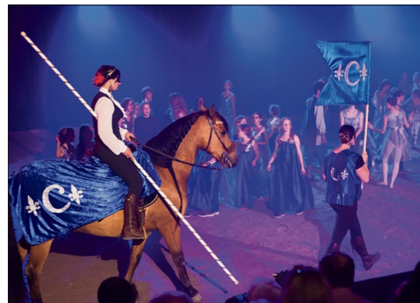
La famille Capulet de Roméo et Juliette et son cavalier.