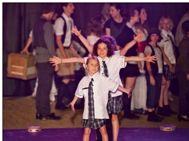
Le ballet du chœur des enfants.